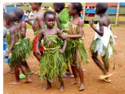
Young members dancing during the Social Gathering

with the girls, but now everything is okay, because we have our own room, which was painted recently with the girls and the Go Ahead!-Members.