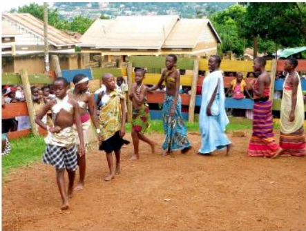
Modeling during the Social Gathering